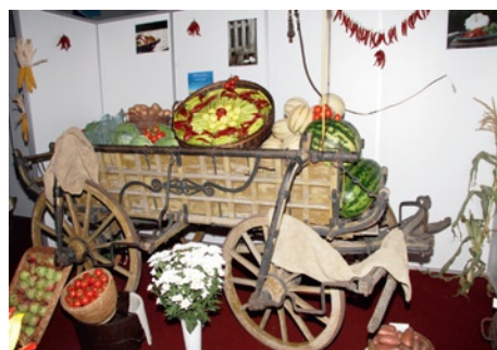
A löcsös kocsira is pakolt csodálatos terményeikre méltán lehetnek büszkék a lajosmizsei gazdák