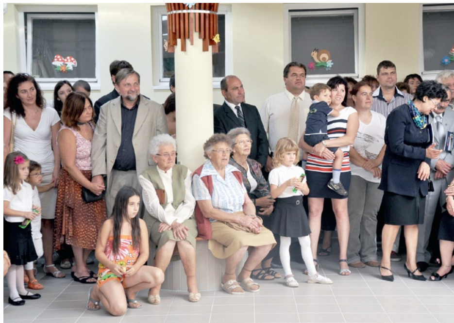
Sok kedves vendég, szülő, érdeklődő kísérté figyelemmel a gyermekek műsorát

6050 Lajosmizse, Attila u. 6. sz. · Tel.:06-76-356-560 · E-mail: mizsovi@freemail.hu