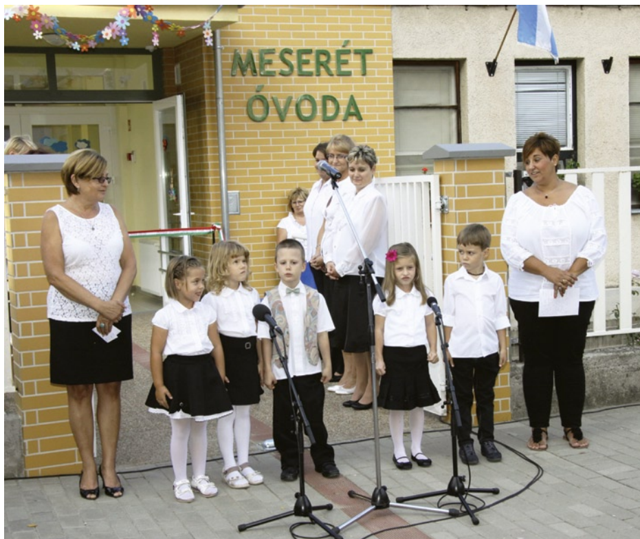
Katica csoportos gyermekek köszöntő verssel készültek

2013.szeptember 1-én ünnepélyes óvodaavató ünnepségen átadásra került a Meserét Óvoda új épülete. Az Új Széchenyi terv keretében a DAOP-4.2.1. „Meserét Óvoda fejlesztése-korszerűsítése” pályázat megvalósítása során a székelyintézmény bővítésére került sor.