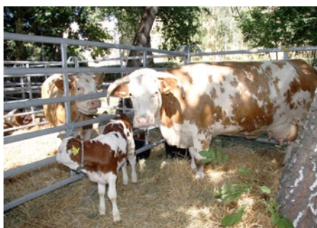
Kicsik és nagyok fokozott érdeklődése kísérte a mezőgazdasági állatkiállítást