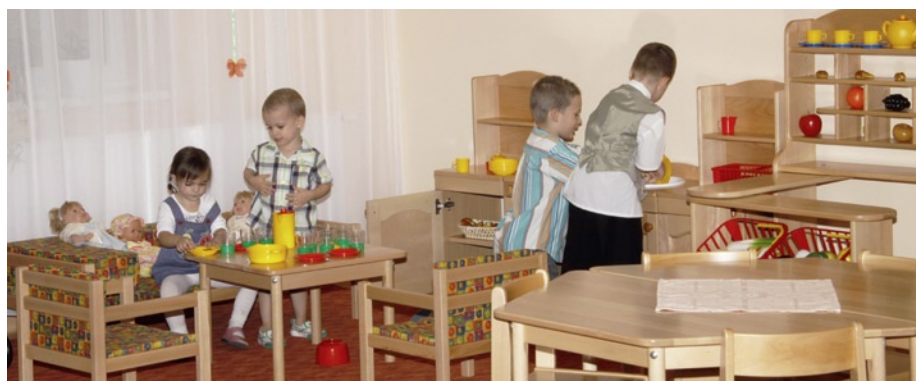
A gyermekek örömmel vették birtokba az új babaszobát