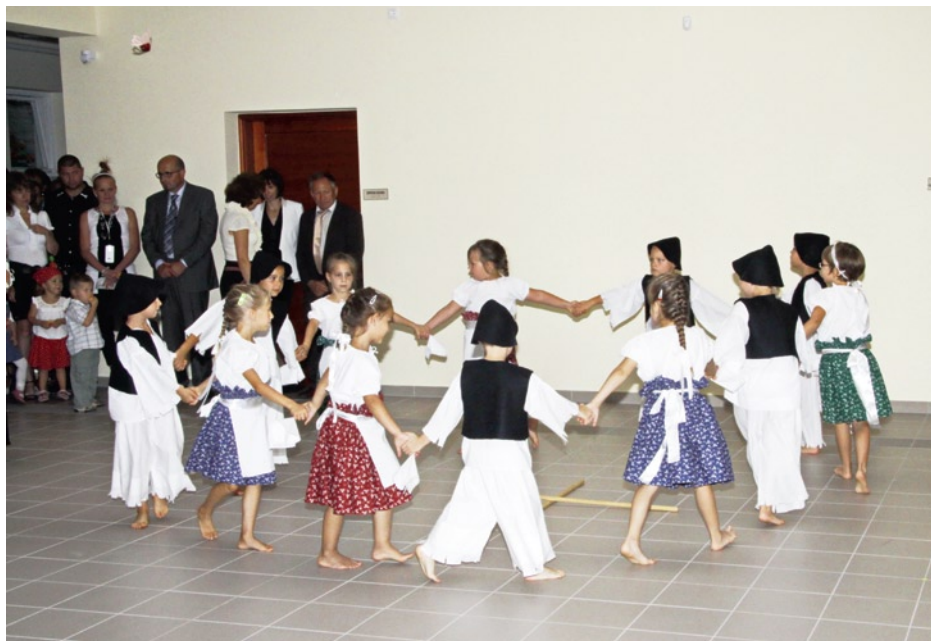
Méhecske csoportos gyermekek kanasztánca az új aulában

Az központi óvoda modern és energetikailag korszerű épülettel gyarapodott. A Meserét Óvoda egy valóságos Mesevárat kapott. A fejlesztéssel három új csoportszoba, szociális helyiségek, torna szoba, logopédiai-fejlesztő helyiség, orvosi szoba építése és belső berendezése valósult meg. A pályázat Európai Unió támogatása 199.500.000.-Ft, a saját forrás 10.500.000.-Ft. Az épület tervezője Dr. Farkas Gábor és Lakó András. A kivitelező a GOMÉP Ipari és Kereskedelmi Kft. Az eszközbeszerzést az Eszterlanc Kft. nyerte el. A pályázati dokumentációt a Lajosmizsei Közös Önkormányzati Hivatal munkatársai, a Megvalósíthatósági Tanulmányt a Meserét Óvoda óvodapedagógusai készítették el. Az építkezés gyorsan és zökkenőmentesen valósult meg. A kivitelezési munkálatok 2013.január 21-től 2013.augusztus 02-ig tartottak. Köszönet minden együttműködő partnernek!