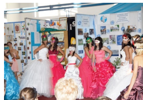
A gyönyörű hölgyek a közösségdíjas Familia Szalon ruháit viselték