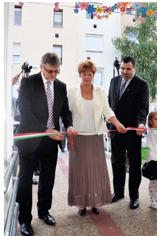
Székhelyintézmény új szárnyának átadása, szalagátvágás

Az központi óvoda modern és energetikailag korszerű épülettel gyarapodott. A Meserét Óvoda egy valóságos Mesevárat kapott. A fejlesztéssel három új csoportszoba, szociális helyiségek, torna szoba, logopédiai-fejlesztő helyiség, orvosi szoba építése és belső berendezése valósult meg. A pályázat Európai Unió támogatása 199.500.000.-Ft, a saját forrás 10.500.000.-Ft. Az épület tervezője Dr. Farkas Gábor és Lakó András. A kivitelező a GOMÉP Ipari és Kereskedelmi Kft. Az eszközbeszerzést az Eszterlanc Kft. nyerte el. A pályázati dokumentációt a Lajosmizsei Közös Önkormányzati Hivatal munkatársai, a Megvalósíthatósági Tanulmányt a Meserét Óvoda óvodapedagógusai készítették el. Az építkezés gyorsan és zökkenőmentesen valósult meg. A kivitelezési munkálatok 2013.január 21-től 2013.augusztus 02-ig tartottak. Köszönet minden együttműködő partnernek!