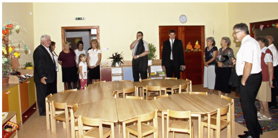
A vendégek először látogattak az új csoportszobákba

A pályázattal olyan beruházás valósult meg, amely az egész várost érinti. A három csoportszoba megépítésével 75 fővel emelkedett a székhelyintézmény férőhelyeinek száma. A 2013-2014-es nevelési évben az óvodai ellátást igénylő gyermek elhelyezését biztosítottuk. A felnőtt létszám 6 fő óvodape-