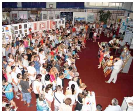
A kiállítók felajánlásainak köszönhetően a tombolasorsolás 266 000 Ft bevételt hozott, amelynek felhasználási célterülete az Iskola-tó és környékének rendezése, parkosítása